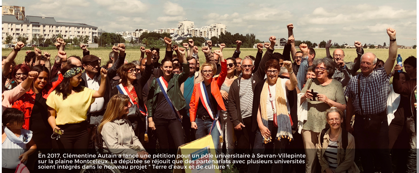
En 2017, Clémentine Autain a lancé une pétition pour un pôle universitaire à Sevrans-Villepinte sur la plaine Montceuleux. La députée se réjouit que des partenariats avec plusieurs universités soient intégrés dans le nouveau projet " Terre d'eaux et de culture "

Alors que la ville voisine s'inscrit dans la création d'une vraie trame verte entre le parc du Sausset et le parc de la Poudrerie, la maire de Villepinte densifie le quartier de la Pépinière. Il faut donner la priorité à l'environnement et au bien-être des Villepintois !